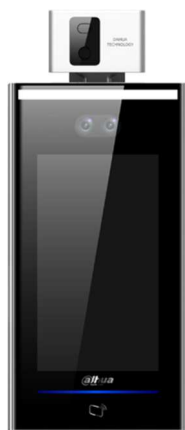
AI 認証付きサーマルカメラ

2020年3月発売の「非接触人体測温システム」とあわせ2機種の取り扱いとなります。