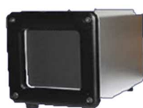
赤外線放射ユニット(温度校正装置) DH-TPC-HBB1